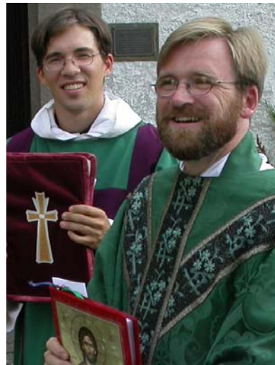
Bilder fra den første messefeiring i Sarpsborg, august 2002.

I forbindelse med planleggingen av synodemøtet til sommeren drøftet Kirkerådet under oktober-møtet, NKKs sentrale økonomi i forhold til de lokale virksomhetene.